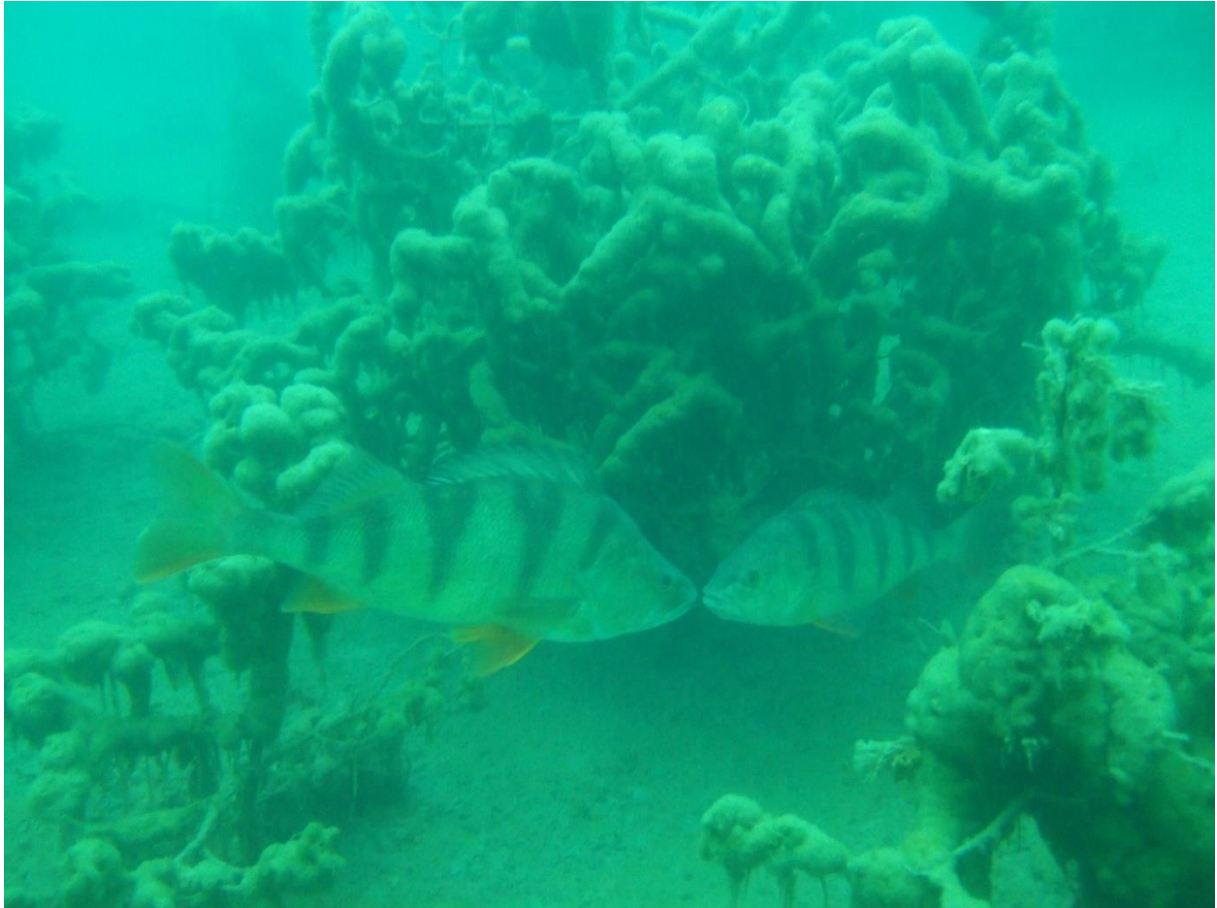
Bild 2. Grova abborrar. I bakgrunden syns träd (tallar) som vuxit upp under tidigare perioder när brottet varit torrlagt. Okända alger har sedan växt på dessa döda träd.