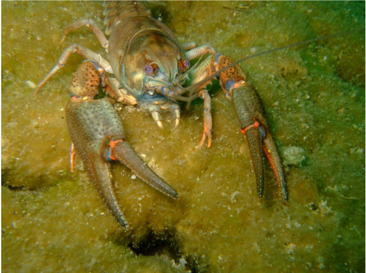
Bild 3. Flodkräfta. Arten är akut hotad i Sverige (CR-listad i Rödlistan 2015) vilket är den högsta hotklassen en art kan få i Rödlistan.