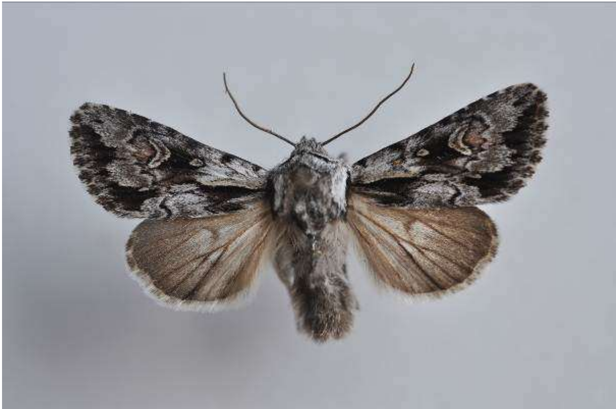
Fig.8. Grått johannesörtfly (vingspann 28- 32 mm)