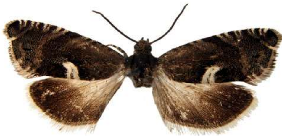
Sb St Vika, Kalkbrottet 10.VI 1992 G. Palmqvist