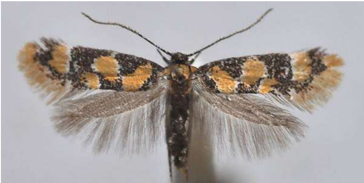
Fig. 32. Guldfläckpraktmal (vingspann 9- 11 mm)