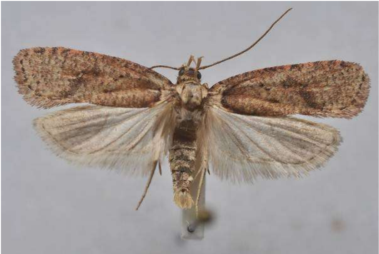
Fig. 27. Sårläkeplattmal (vingspann 20- 23 mm)