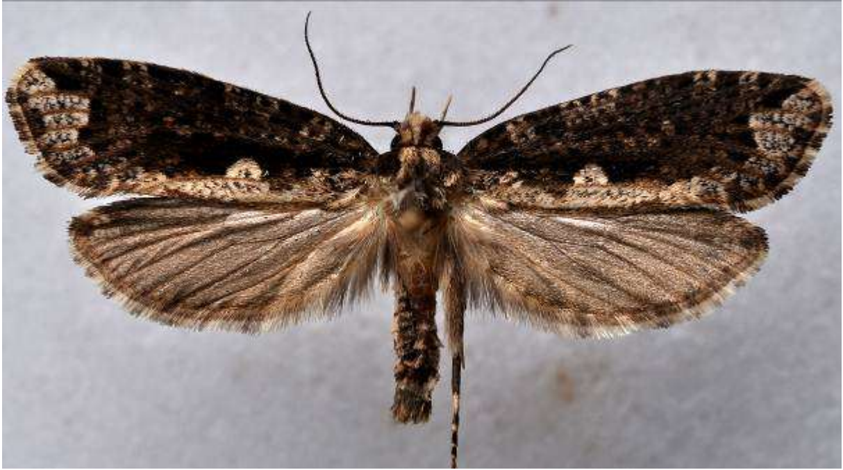
Fig. 37 Jättesvampmal (vingspann 34- 50 mm)