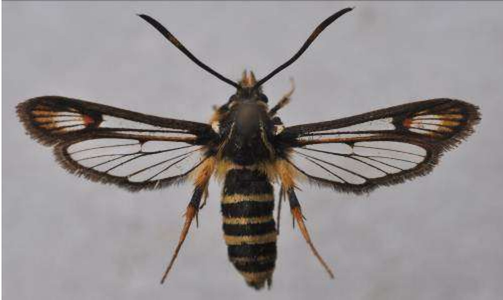
Fig. 18. Smygstekellik glasvinge (vingspann 13- 24 mm)