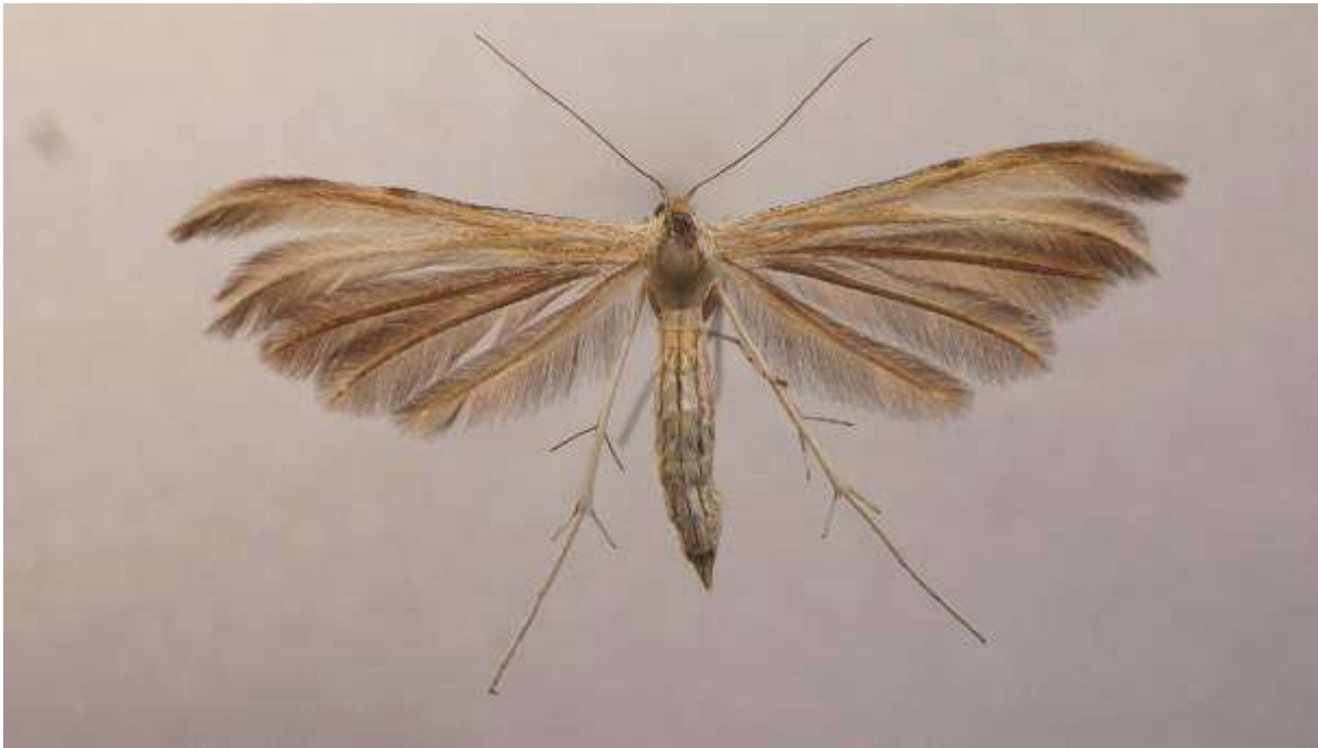
Fig.24. Kungsmyntefjädermott (vingspann 20- 27 mm)