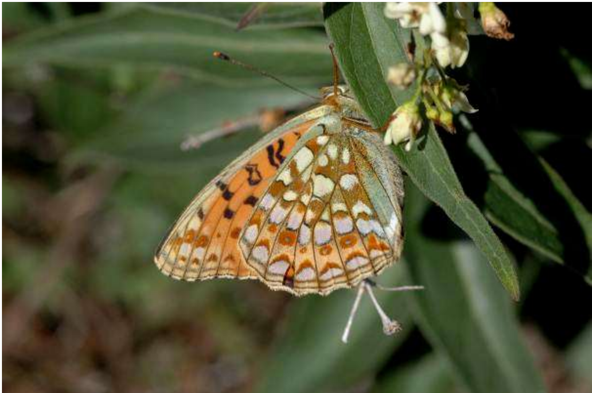
Fig. 1. Hedpärlemorfjäril (vingspann 41- 52 mm)