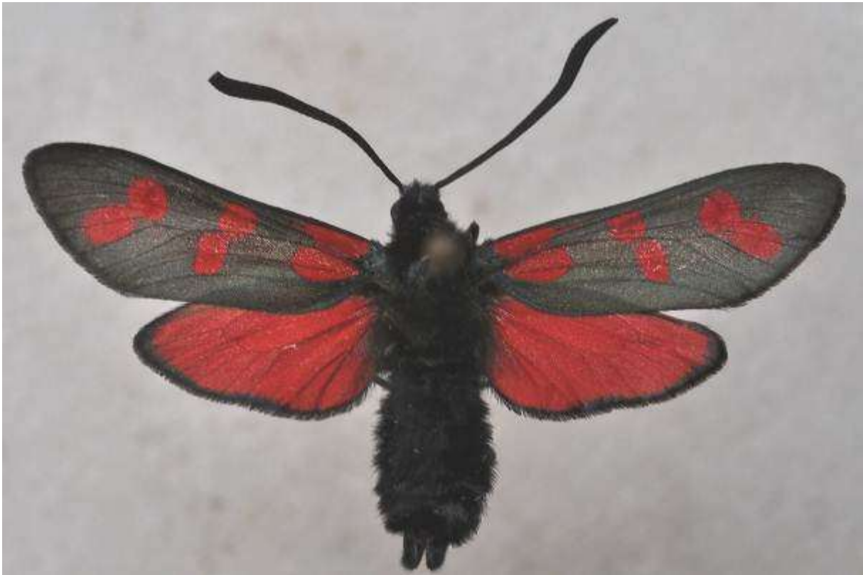
Fig. 20. Allmän bastaardsvärmare (vingspann 28- 39 mm)