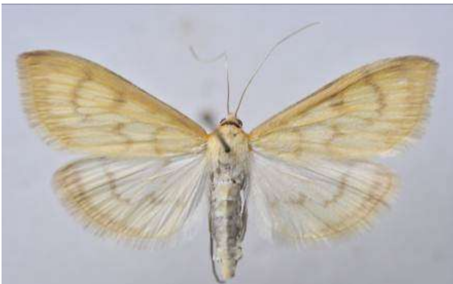
Fig. 25. Sidengult ängsmott (vingspann 27- 34 mm)