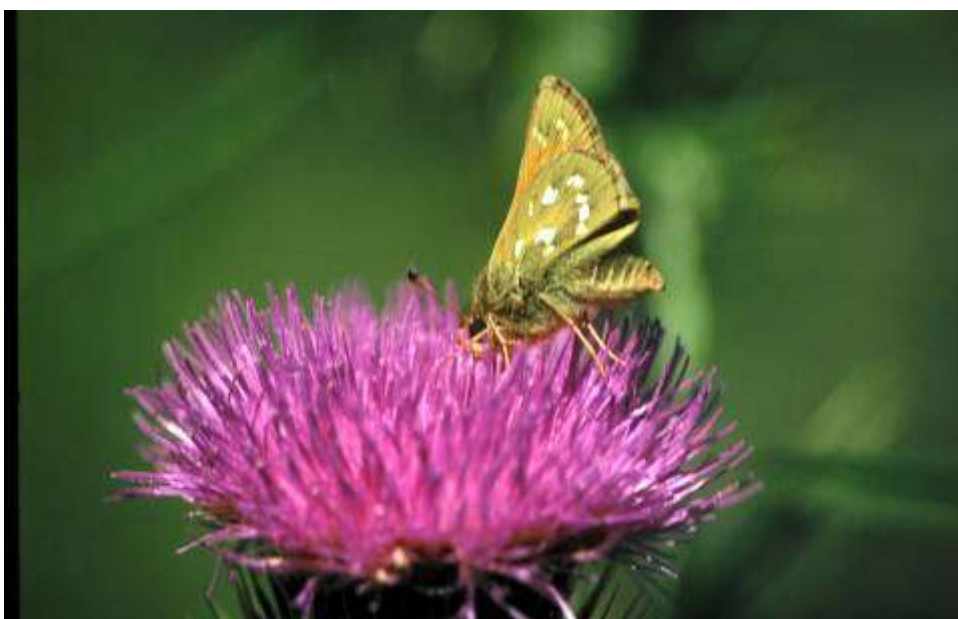
Fig. 3. Silversmygare (vingspann 25 – 32 mm)