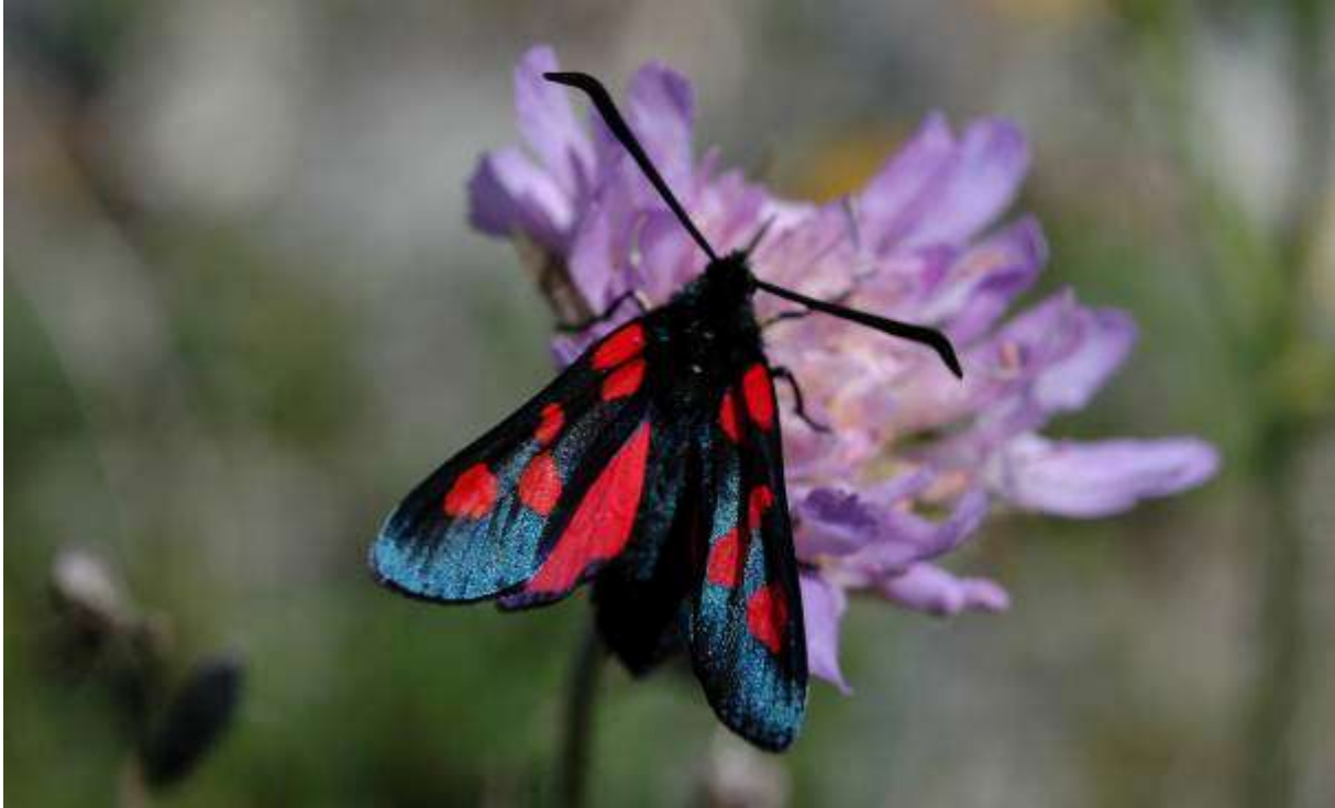
Fig. 21. Bredbrämad bastardsvärmare (vingspann 30- 42 mm)