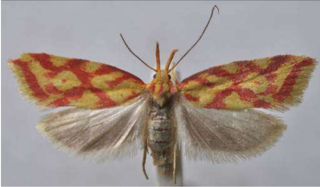
Fig. 33. Jungfrulinpraktmal (vingspann 15- 20 mm)