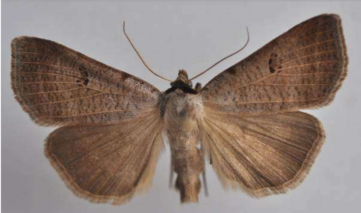
Fig. 11. Tvärinjerat vickerfly (vingspann 35- 40 mm)