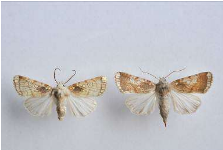
Fig. 9. Kretsfly (vingspann 30- 35 mm)