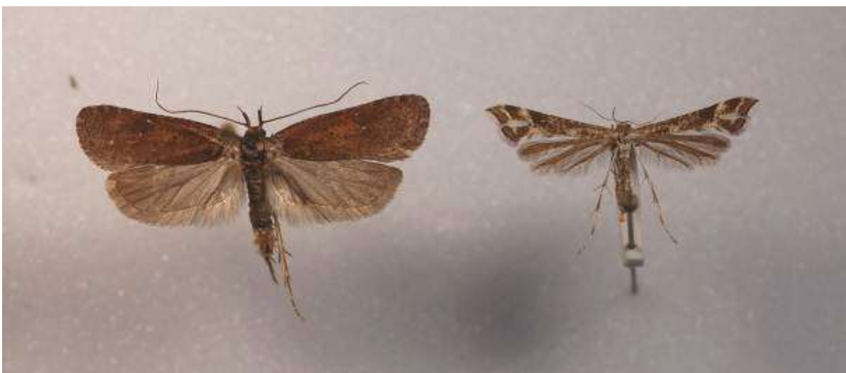
Fig. 34. Leverplattmal (vingspann 20- 25 mm) till vänster och kattfotfjädermott (vingspann 17- 20 mm) till höger