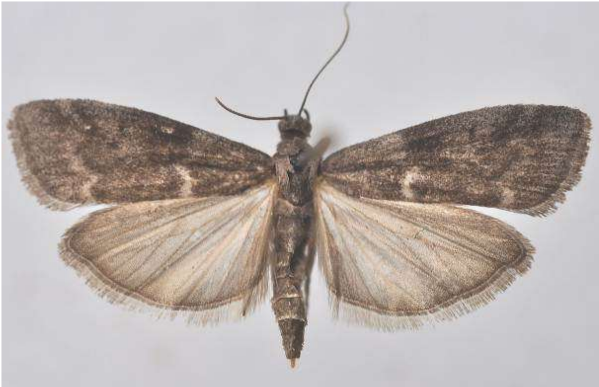
Fig. 23. Skiktdynemott (vingspann 15- 25 mm)