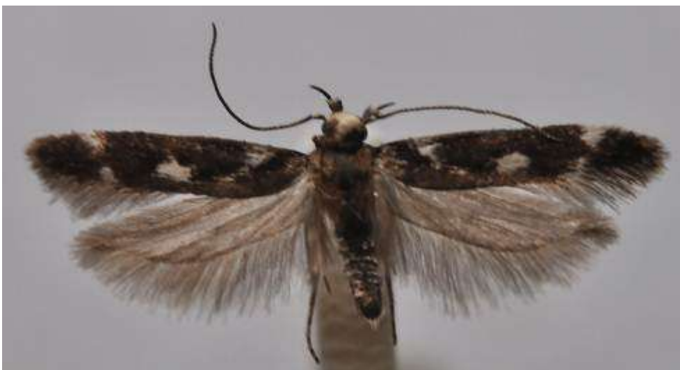
Fig. 28. Svartvit backglimmal (vingspann 11- 13 mm)