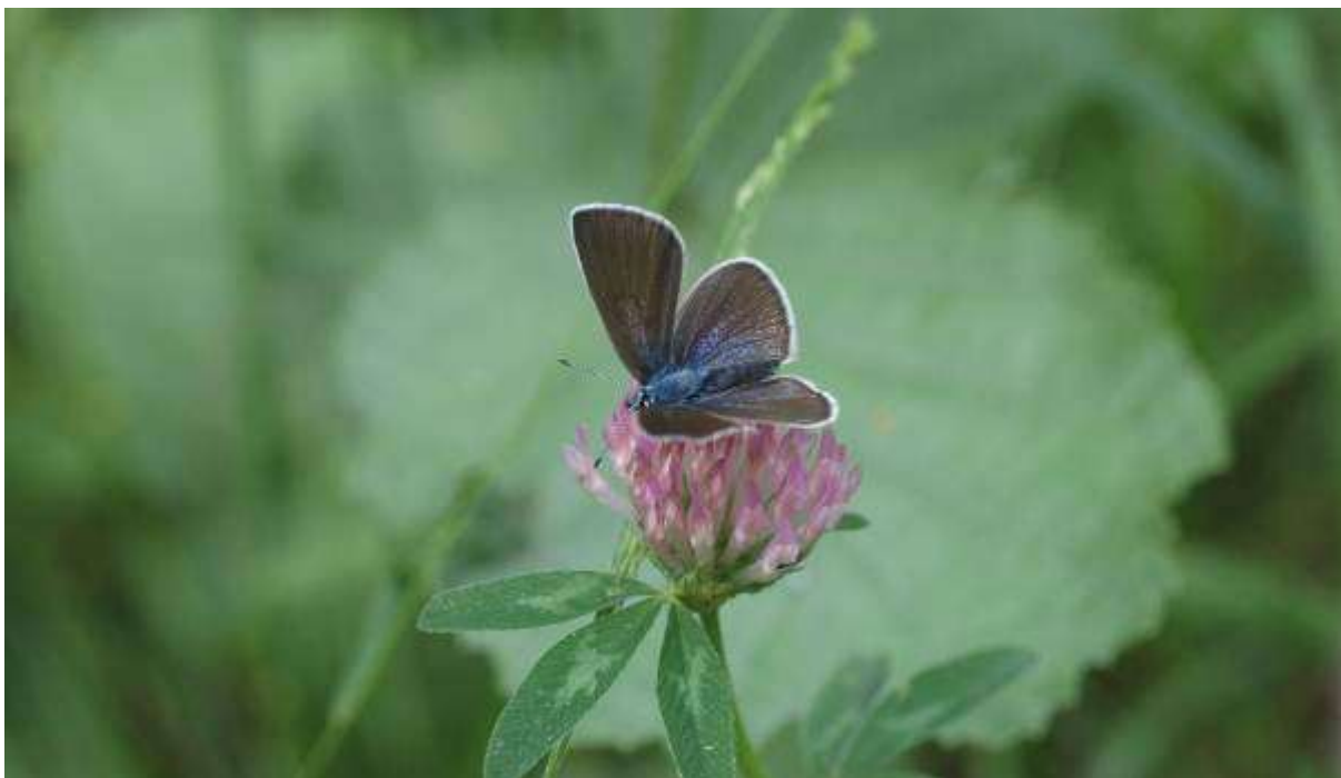
Fig. 2. Mindre blåvinge (vingspann 18- 25 mm)