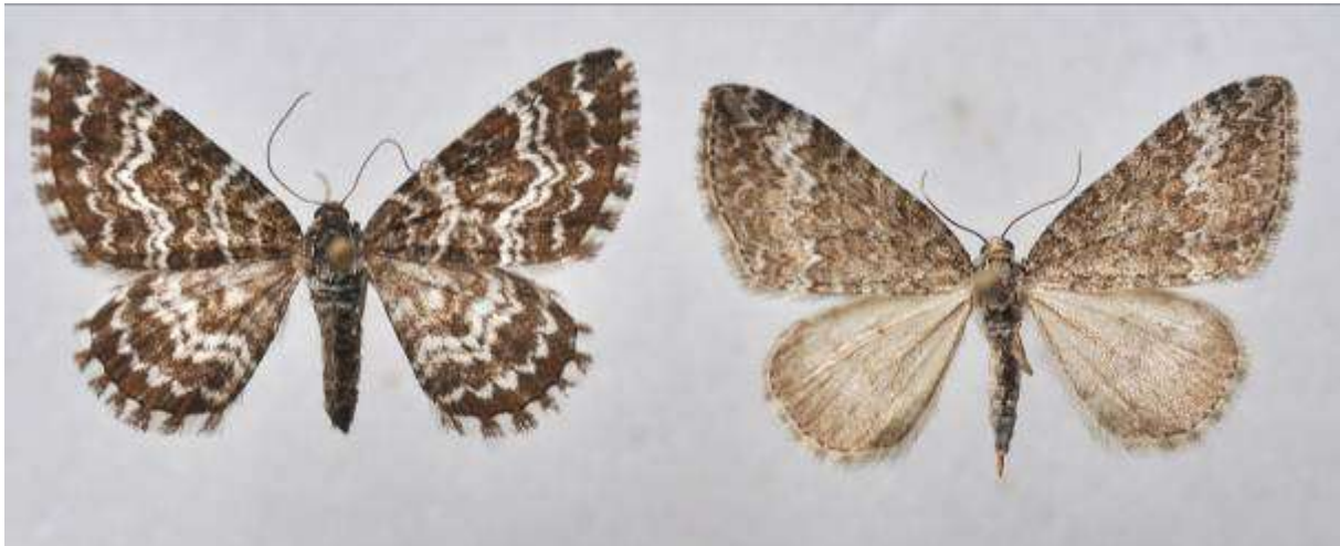
Fig. 14. Thunbergs fältmätare (vingspann 21- 24 mm) till vänster och glimfältmätare (vingspann 18 – 22 mm) till höger.