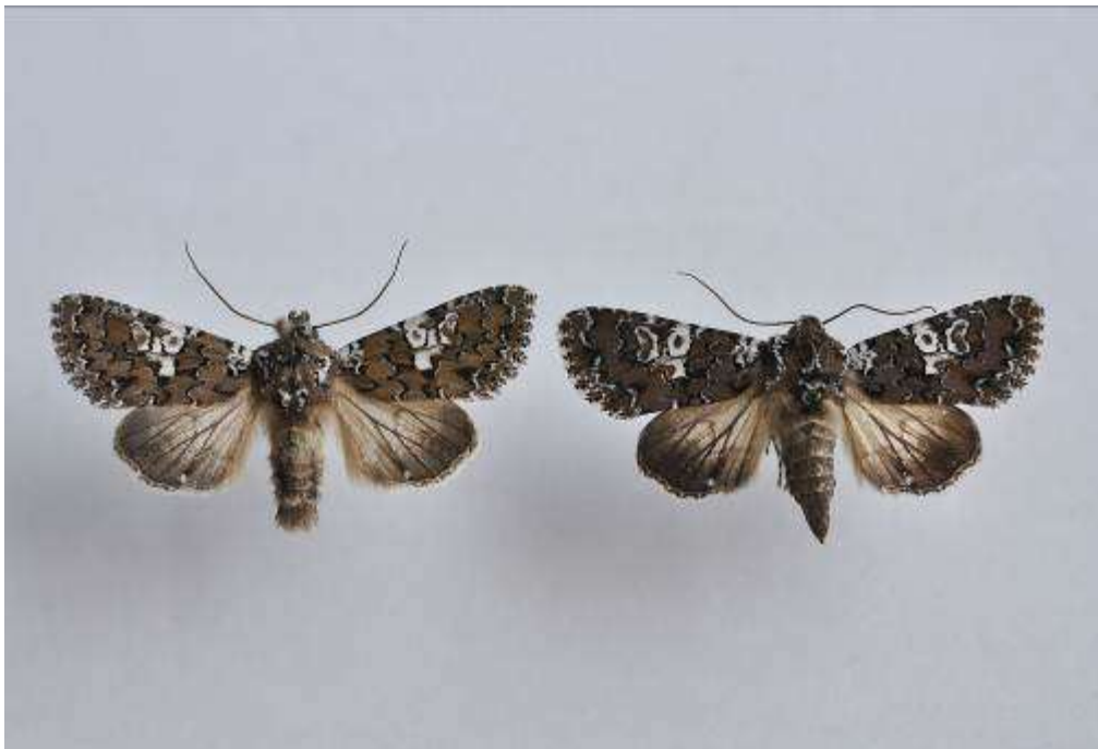
Fig. 10. Olivbrunt nejlikfly (vingspann 32- 36 mm)