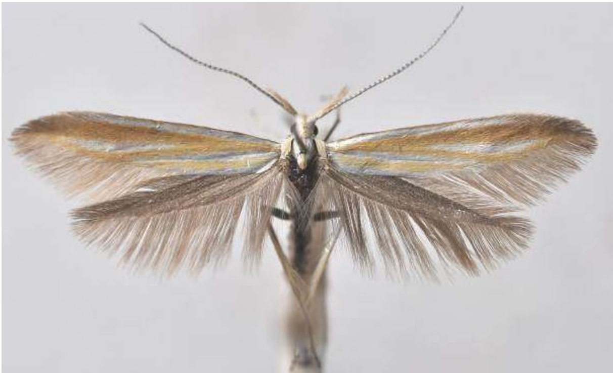
Fig. 31. Kilstreckad rölleksäckmal (vingspann 16- 19 mm)