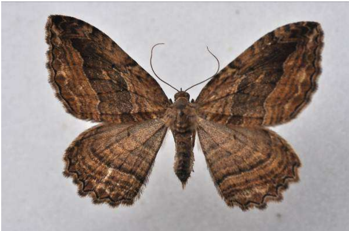
Fig. 17. Svartbrun klaffmätare (vingspann 30- 35 mm)