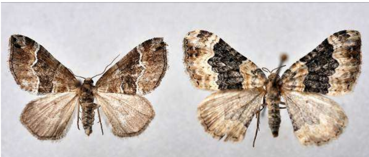
Fig. 16. Snedstreckad fältnätare (vingspann 18- 21 mm) till vänster och mårefältnätare (vingspann 22- 27 mm) till höger.