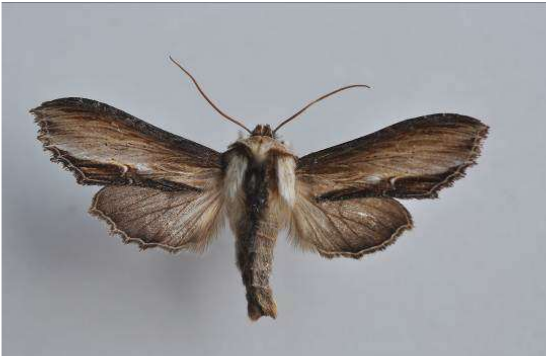
Fig. 13. Kungsljuskapuschongfly (vingspann 47- 50 mm)