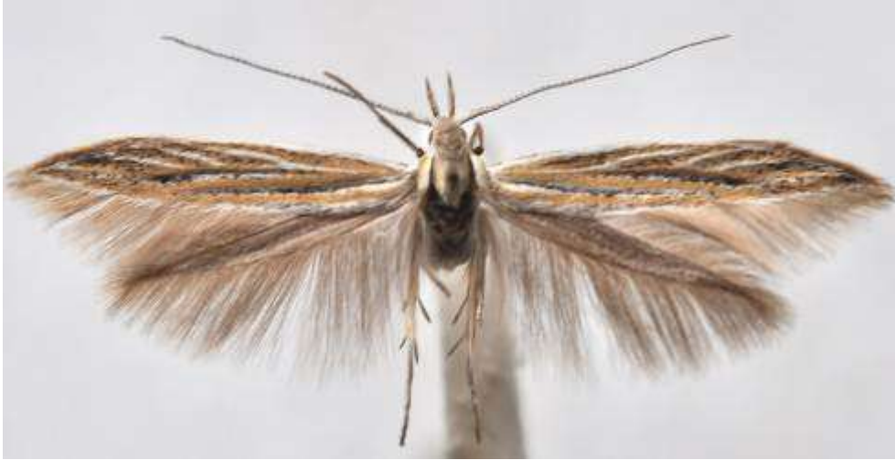
Fig. 30. Punkterad backglimsäckmal (vingspann 13- 16 mm)