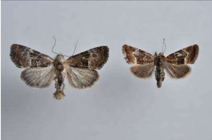
Fig. 12. Dvärgängsfly, hane till vänster och hona till höger Vingspann (16- 20 mm)