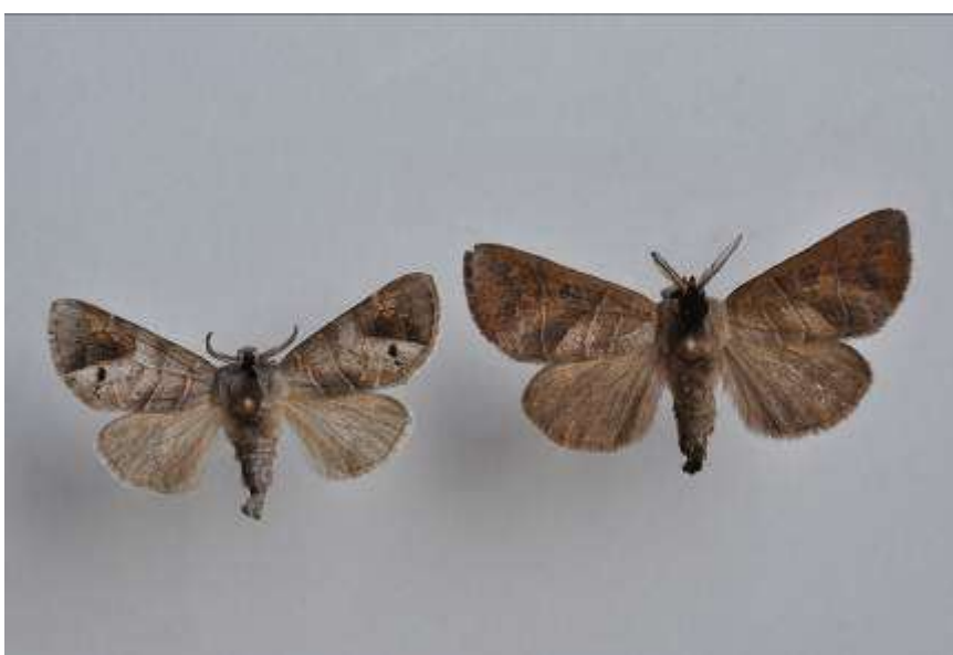
Fig. 6. Svartfläckig högstjært (vingspann 31- 39 mm) till vänster och brungrå högstjært till höger (vingspann 31- 44 mm)