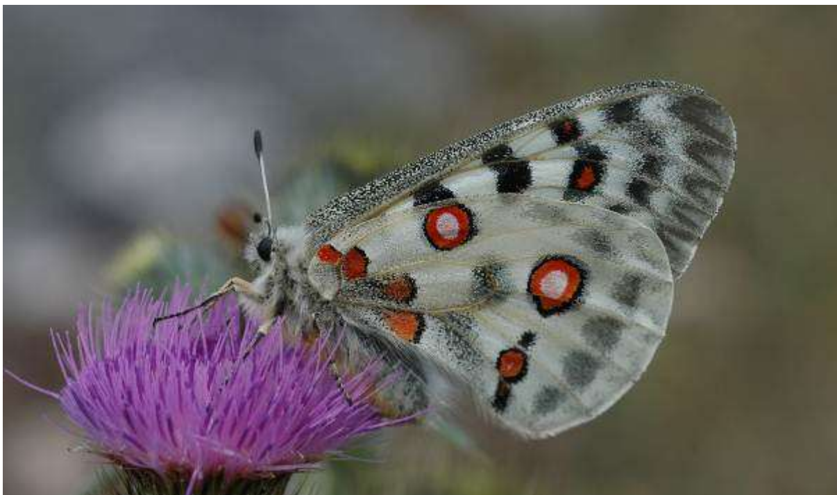
Fig. 5. Fastlandspollofjäril (vingspann 62- 87 mm)