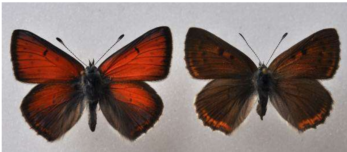
Fig. 4. Violettkantad guldvinge (vingspann 30- 35 mm). Hane till vänster, hona till höger)