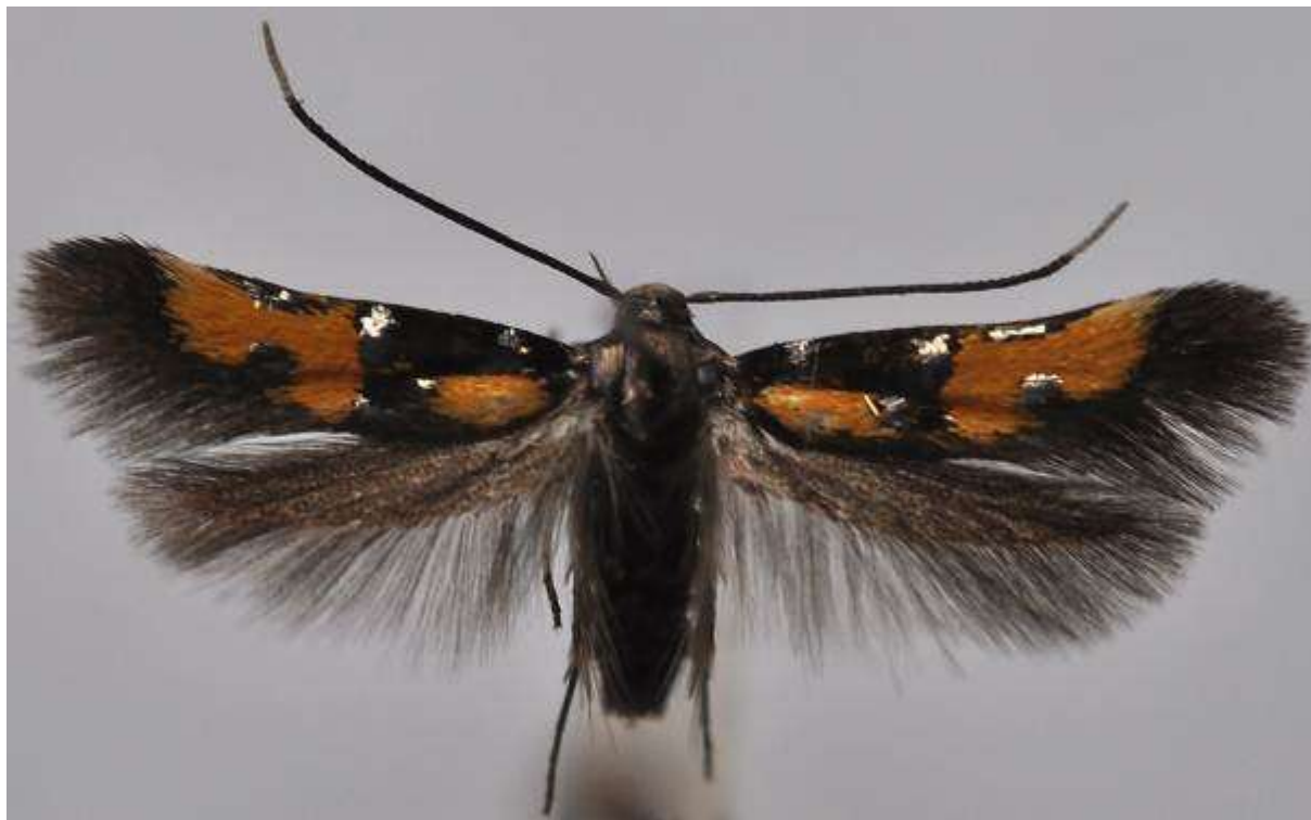
Fig. 29. Sälgbrokmal (vingspann 11- 13 mm)