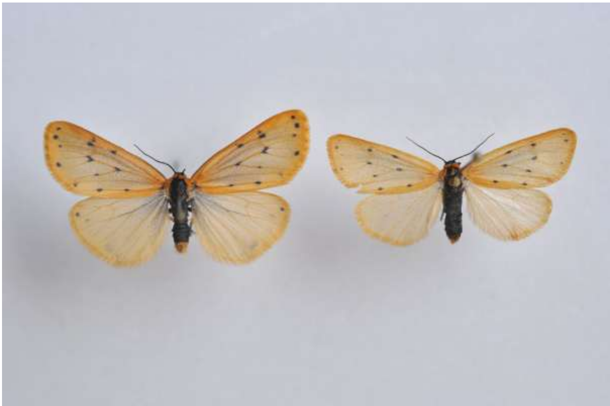
Fig. 7. Större borstspinnare, hane (vingspann 27- 35 mm) till vänster och hona (vingspann 22-28 mm) till höger