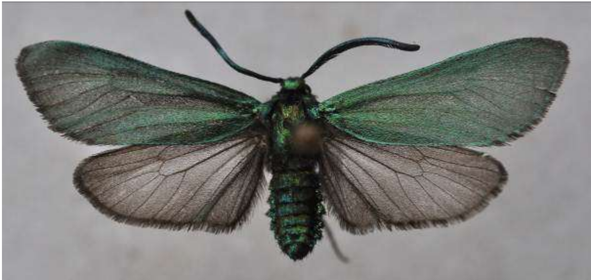
Fig. 17. Allmän metallvingesvärmare (vingspann 22- 29 mm)