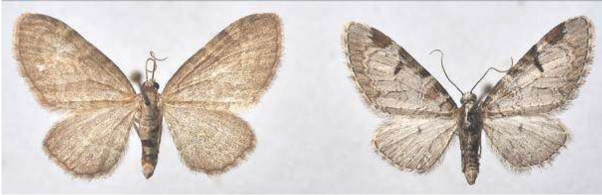
Fig. 15. Oren malmätare ( vingspann 17- 20 mm) till vänster och hagtornsmalmätare (vingspann 19- 20 mm) till höger